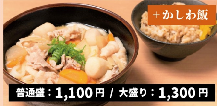
F. 具沢山豚汁うどん