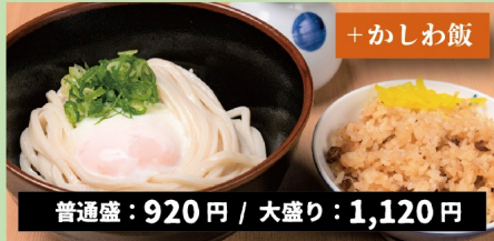
D. 温玉ぶっかけうどん